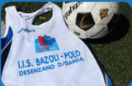
La maglia dei campionati provinciali di calcio