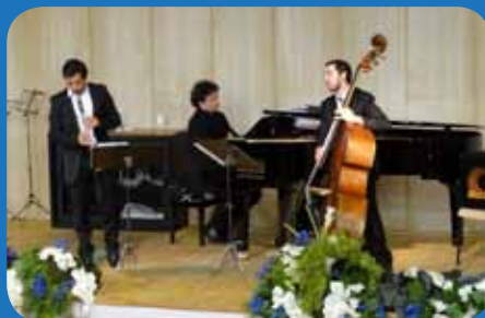
Il concerto organizzato in occasione del 60° anniversario del Bazoli