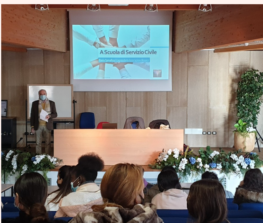
Associazione Mosaico durante un incontro scolastico

Rafforzando i propri contatti con le scuole e le università lombarde, Associazione Mosaico si propone di creare un ponte diretto tra la formazione e il mondo del lavoro, facendo sì che l'esperienza di Servizio Civile o Leva Civica possa essere svolta parallelamente alla carriera universitaria e prepari i volontari ad operare in contesti di lavoro complessi