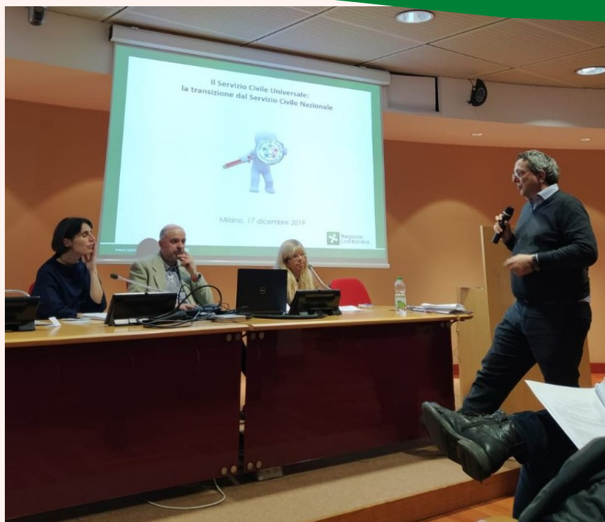
Ass.ne Mosaico presenta FOOL al Dipartimento per le Politiche Giovanili e il Servizio Civile Universale

nel 2021 Associazione Mosaico ha lanciato un progetto sperimentale, insieme ai Centri Per l'Impiego della provincia di Bergamo, per la certificazione delle competenze acquisite durante il periodo di Servizio Civile o Leva Civica. la presentazione completa è disponibile sul nostro sito .